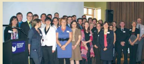
Une équipe de professionnels fiers de contribuer à la croissance et au rayonnement de PESCA Environnement.

PESCA Environnement compte une quarantaine de professionnels fournissant plusieurs services reliés à l'environnement : biologie, ingénierie, géologie, hydrologie, foresterie, géographie, géomatique, agronomie, communications. L'expertise et les connaissances de chacun créent un contexte multidisciplinaire et offrent l'avantage d'une analyse globale des enjeux environnementaux d'un projet. En accompagnant ses clients au Québec, dans les provinces maritimes et en Ontario, l'entreprise contribue au succès de leurs projets.